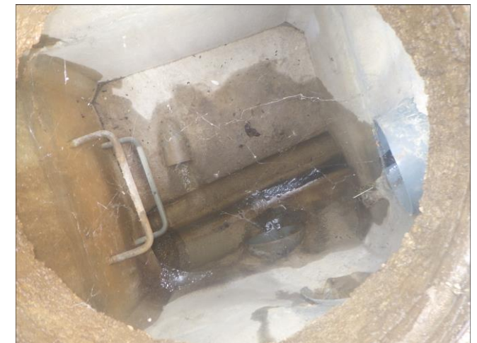
Regard unitaire – Rue du Balland