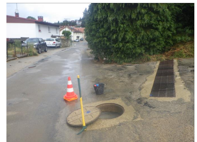
Regard unitaire – Rue du Balland