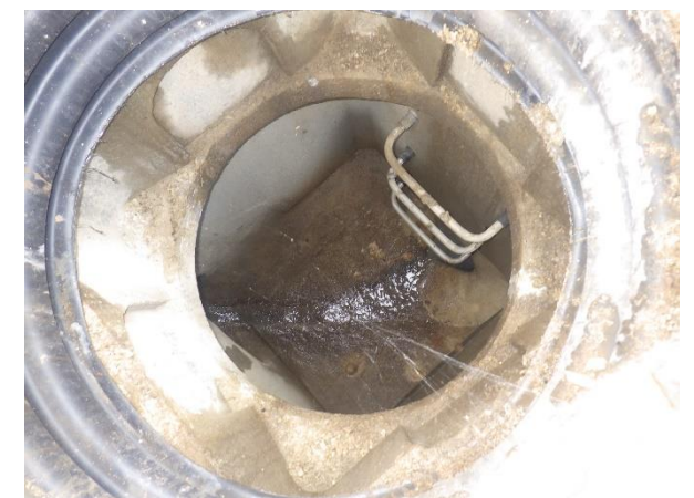
Réseau unitaire du Mont Ramey