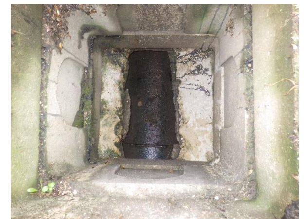
Réseau unitaire du Mont Ramey