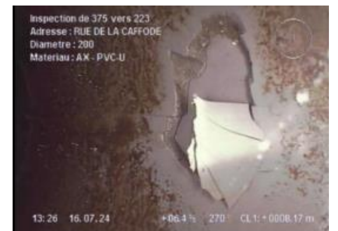
Trou dans revêtement Rue de la Caffode