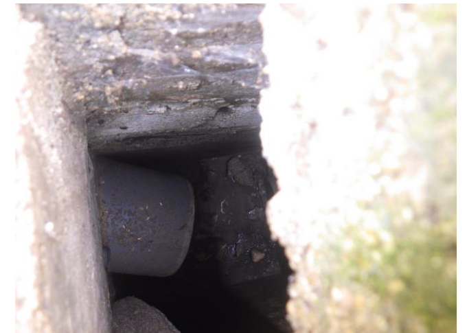
Regard unitaire – Rue de la Coté