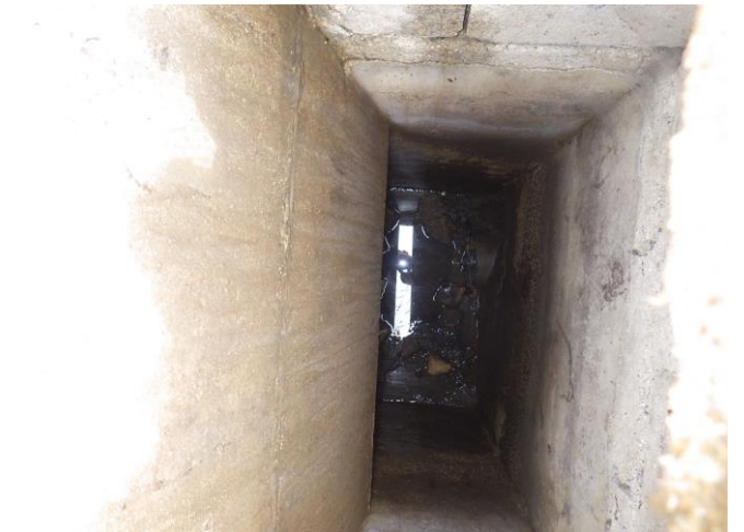
Regard unitaire – Rue de la Coté