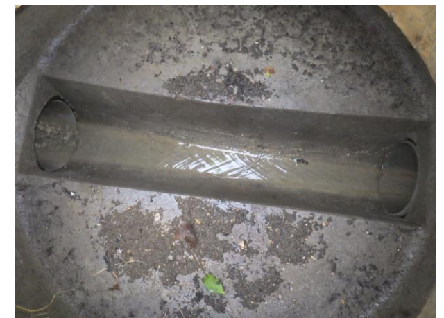
Regard unitaire – Les Maillots