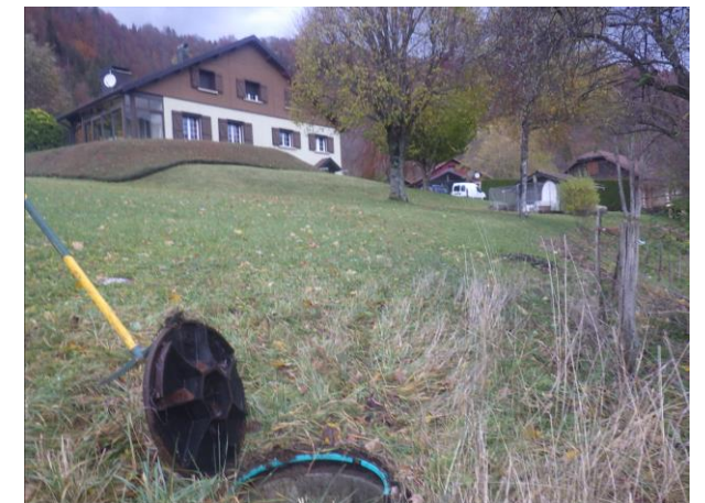
Regard unitaire – Les Maillots