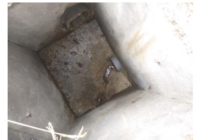
Regard unitaire – Route des Alpes