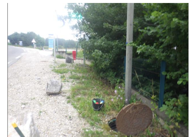
Regard unitaire – Route des Alpes