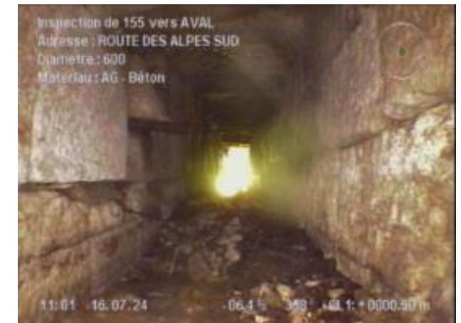
Dalot unitaire – Route des Alpes