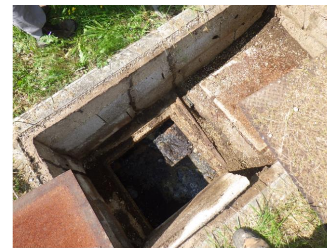
Fosse toutes eaux – Rue du Champ Saillard