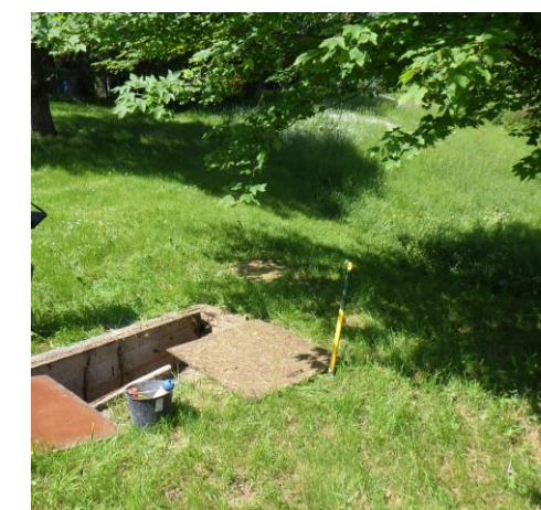
Fosse toutes eaux – Rue du Champ Saillard